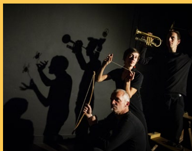
Le cri des minuscules