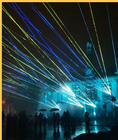
Festivités de Noël