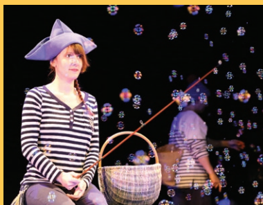
20 000 bulles sous les mers